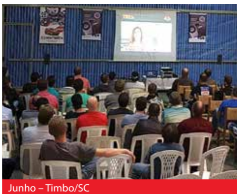
Junho - Timbo/SC

Nos últimos meses o Projeto T.E.M (Treinamento Especializado Mobensani), CRUZOU o Brasil, literalmente, de norte a sul. Agradecemos a todos os participantes, vejam algumas fotos dos locais que estivemos.