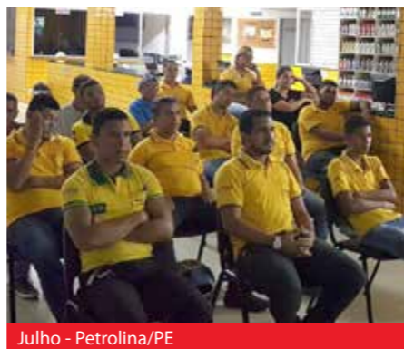
Julho - Petrolina/PE